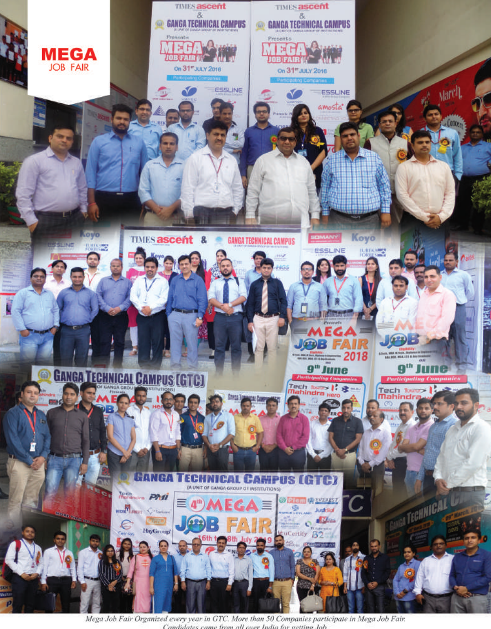
Candidates came from all over India for getting Job.